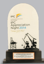
Top Dry Bulk Cargo Owner 2014 - IPC II