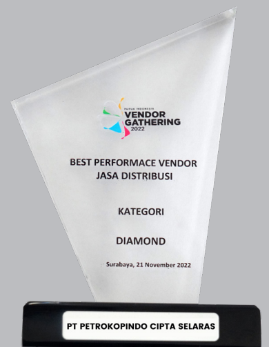
Best Performance Vendor Jasa Distribusi Kategori Diamond 2022 - Vendor Gathering