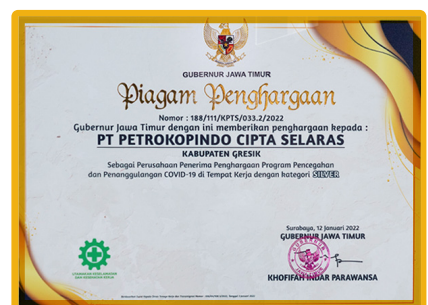
Penghargaan Gubernur Jawa Timur dalam melaksanakan Program Pencegahan dan Penanggulangan COVID-19 di tempat kerja Kategori SILVER