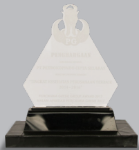
Tingkat Kesehatan Perusahaan Terbaik 2014-2016 - Petrokimia Gresik