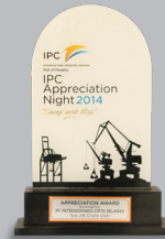
Top JIB Crane User 2014 - IPC II