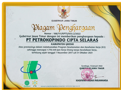
Penghargaan Gubernur Jawa Timur dalam melaksanakan Program Keselamatan dan Kesehatan Kerja (K3) sehingga mencapai 1.778.449 jam kerja tanpa kecelakaan kerja.