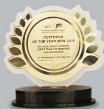
Best Dry Bulk Cargo Owner 2014-2015 - IPC II