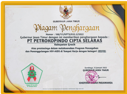
Penghargaan Gubernur Jawa Timur dalam melaksanakan Program Pencegahan dan Penanggulangan HIV-AIDS di tempat kerja Kategori SILVER