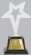
Terbaik 2 Kategori Jasa dan lainnya KPP Madya Sidoarjo 2016